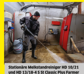
Stationäre Melkstandreiniger HD 10/21 und HD 13/18-4 S St Classic Plus Farmer