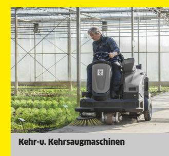
Kehr- u. Kehrsaugmaschinen