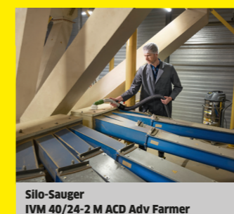
Silo-Sauger IVM 40/24-2 M ACD Adv Farmer