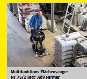
Multifunktions-Flächensauger NT 75/2 Tact² Adv Farmer